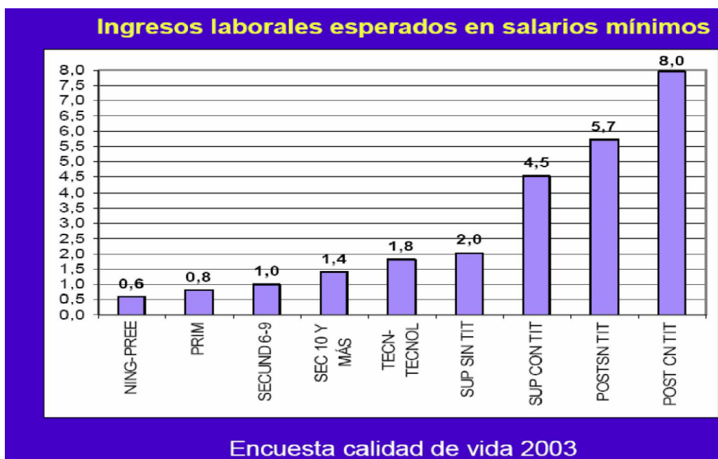
Gráfica 1: Ingresos laborales esperados en salarios mínimos de acuerdo con nivel de escolaridad

En un estudio realizado por Misión para el diseño de una estrategia para la reducción de la pobreza y la desigualdad – ASCUN- Octubre de 2005, se concluyó que hasta secundaria los trabajadores ganan el salario mínimo o menos. El nivel de educación está fuertemente ligado al quintil de ingresos y por ende, a la pobreza. La educación superior escasamente llega a la población pobre y está en su mayoría concentrada entre el cuarto y quinto quintil de ingresos. Puede observarse en la gráfica 1, cómo a medida que aumenta el nivel de escolaridad, también lo hace el nivel salarial. Igualmente para aquellas personas que asisten a educación superior pero no se gradúan (desertores) el nivel salarial está 2.5 salarios mínimos por debajo de quienes efectivamente se gradúan.